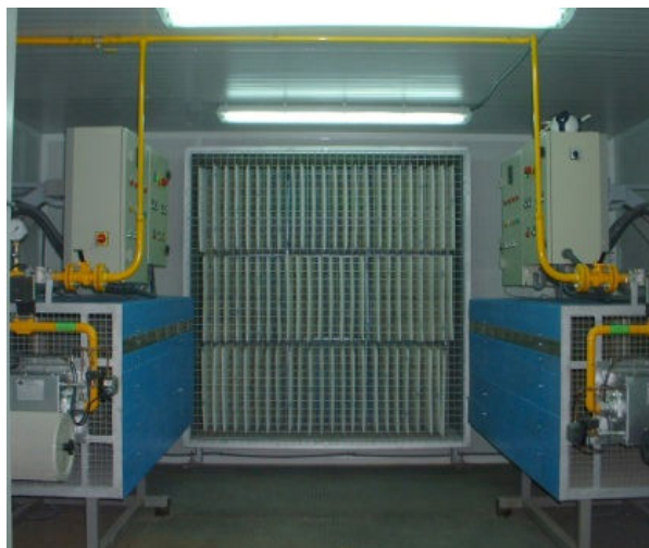
Komora generująca gorące powietrze

W firmie PROSEC zawsze w sposób ciągły współpracowaliśmy z różnymi firmami. Należy podkreślić wagę tej współpracy, ze względu na ilość i znaczenie operacji przeprowadzonych w różnych fabrykach należących do grupy LEVANTINA, firmy o znaczącej pozycji w branży na poziomie krajowym i międzynarodowym. Współpraca ta obejmowała nowe urządzenia do suszenia, wykończenia i jednorodnego podgrzewania materiału oraz zastąpienie dużej części technologii, przerabiając instalacje, w celu zwiększenia ich efektywności (mniejsze zużycie energii, większa jednorodność, większa produkcja i wyższa jakość).