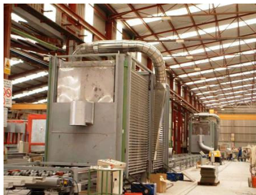
Urządzenie do suszenia i wykończenia płyt marmuru

Ponadto PROSEC realizuje prace, napraw i modyfikacji całych zakładów i poszczególnych urządzeń jak na przykład: