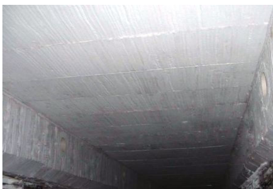
Ściany i sufit z bloków z włókna