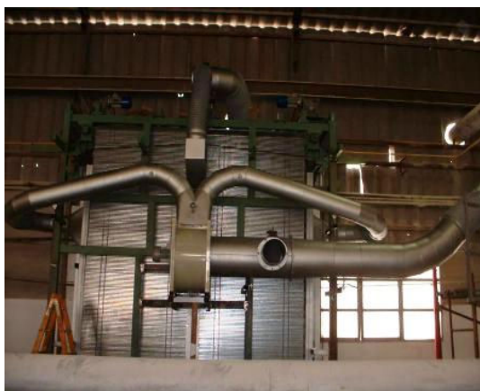
Suszarnia pionowa do ciętych płyt marmuru